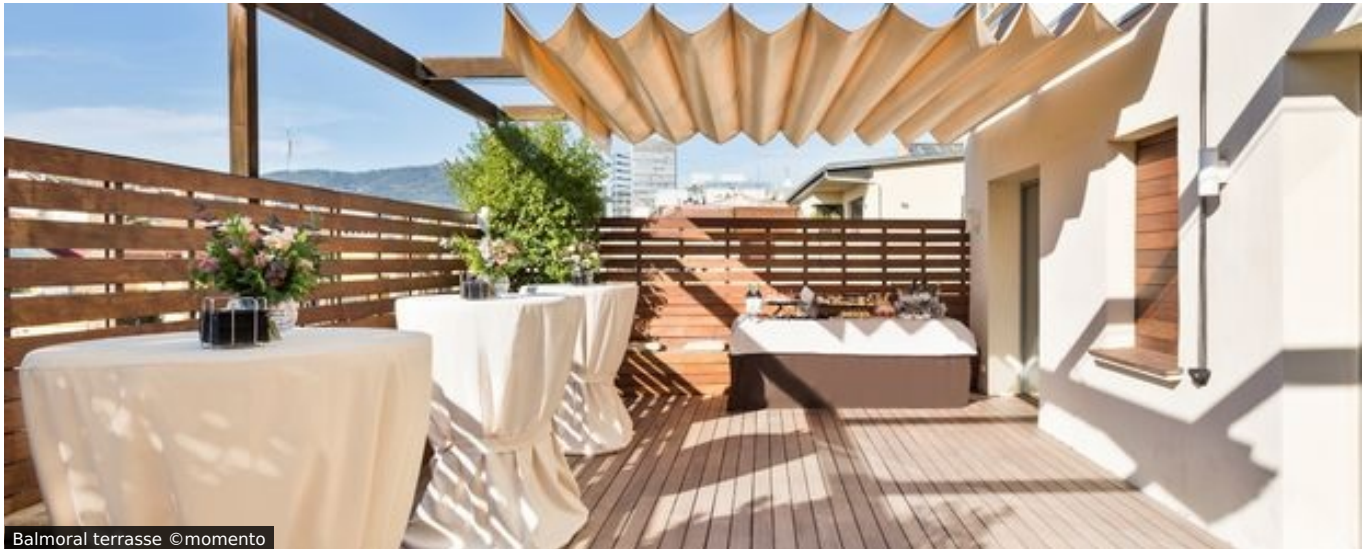
Balmoral terrasse