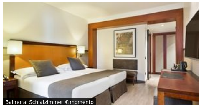
Balmoral Schlafzimmer

Lage & Ausstattung: Im Herzen der Stadt gelegen, ist das Hotel Balmoral, ideal, um Barcelona zu erkunden. Ganz in der Nähe des Passeig de Gracia und Gaudís Casa Milà, ist es auch nur ein kurzer Fußweg zur Rambla de Catalunya. Von hier lässt sich der Innenstadtbereich gut erkunden. Tauchen Sie ein in das quirlige Leben der katalonischen Metropole. Das Hotel ist sehr beliebt und verfügt über eine Sonnenterrasse, einen Frühstücksraum und einen kleinen Fitnessbereich.